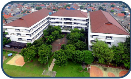
Fakultas Ekonomi dan Bisnis