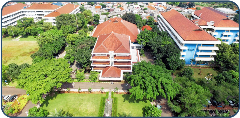
Kampus Program Diploma (D3, D4), Sarjana (S1), dan Profesi: Srengseng Sawah, Jagakarsa Jakarta Selatan, 12640