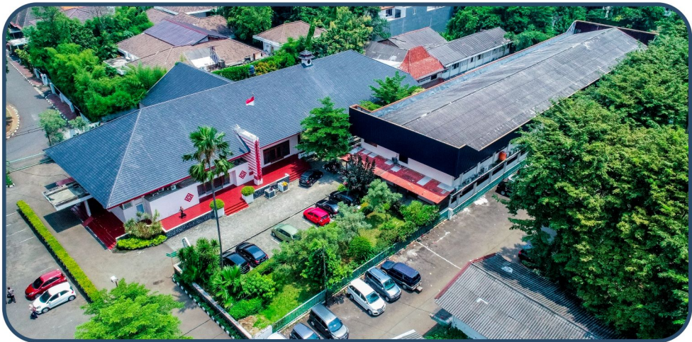
Kampus Program Magister (S2) dan Doktor (S3): Jl. Borobudur Nomor 7, Jakarta Pusat 10320