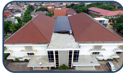
Fakultas Ilmu Komunikasi