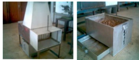
Gambar 1 Alat penukar kalor dan tungku pembakaran

Penelitian ini menggunakan alat penukar kalor plat datar dan tungku pembakaran yang terbuat dari bahan aluminium. Bentuk tungku pembakaran bahan bakar batubara disesuaikan dengan bentuk alat penukar kalor plat datar yang digunakan, sedangkan dimensi tungku pembakaran disesuaikan dengan jumlah bahan bakar yang akan digunakan, sebagaimana Gambar berikut.