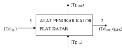
Gambar 3 Temperatur sebelum dan setelah alat penukar kalor

Laju perpindahan panasnya secara umum bergantung kepada sifat-sifat fluida kerja, dimensi serta tingkat keadaan fluida yang melewati permukaan alat penukar kalor tersebut. Laju perpindahan panas dari sebuah alat penukar kalor plat datar yang terletak tegak lurus terhadap suatu aliran udara dapat dievaluasi melalui Gambar berikut: