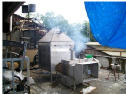
Gambar 4 Alat penukar kalor plat datar diletakkan di atas tungku pembakaran pada mesin pengering RDF

Hal ini perlu dilakukan untuk mengetahui besarnya masa jenis, konduktivitas thermal, kalor spesifik, viskositas dinamik dan bilangan prandtl dari masing-masing fluida yang sedang mengalir melalui alat penukar kalor.